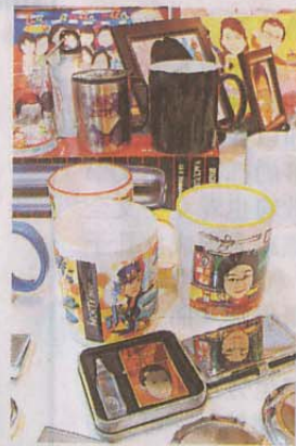
The Morty Shop卡通頭像可以按要求的產品上，背景更可以按要求的設計。